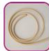
Резиновый жгут, катетер или сверну- тая в жгут ткань