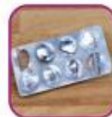
Пустые упаковки от противоаллергиче- ских препаратов