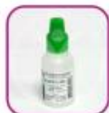
Стеклянный пузырек (из-под нафтизина и пр.)