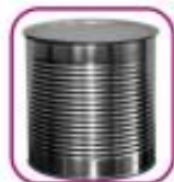
Жестяная банка с вырезанным «окошком»