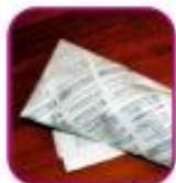
Целлофановый или газетный сверток