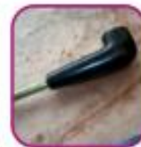
Предметы напомина- ющие курительные трубки