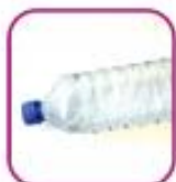
Пластиковая бутылка 0,3-0,5 литров